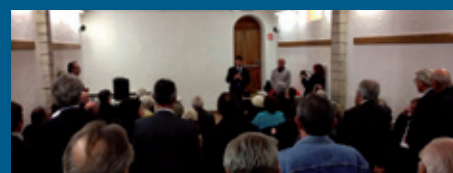
Réunion de proximité St-Vallier-de-Thiery le 22 mai 2013