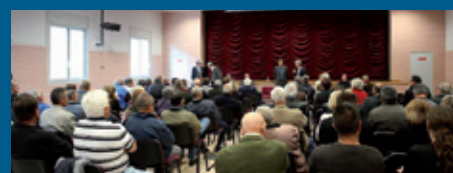
Réunion de proximité Puget-Théniers le 29 mai 2013