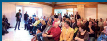
Réunion de proximité Carros le 6 mai 2013